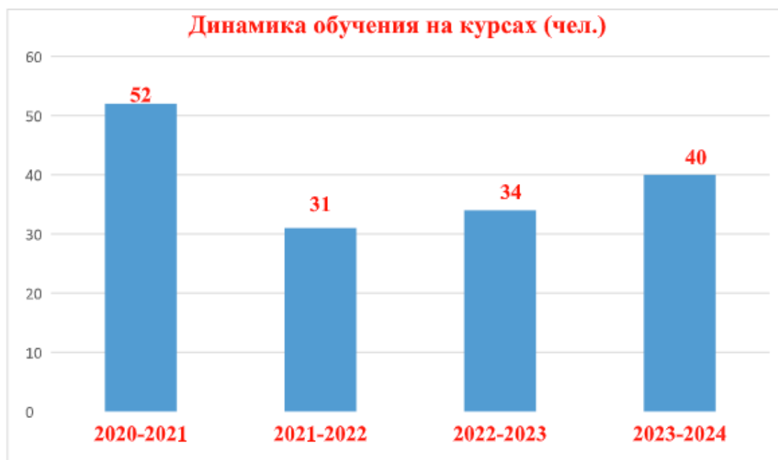
Рисунок 1. Динамика обучения на курсах с 2020 по 2024 гг.