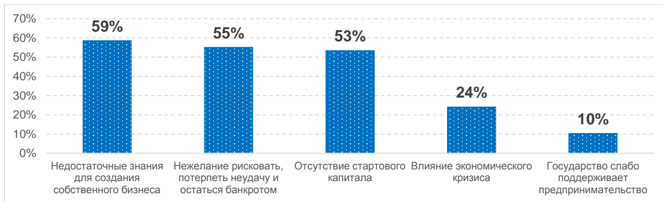
Рис. 3 Ответы обучающихся на вопрос «Какие могут быть причины отказа от идеи создания собственного бизнеса, на Ваш взгляд?»

Результаты исследования позволили определить рейтинг причин, сдерживающих молодежь от создания своего бизнеса: